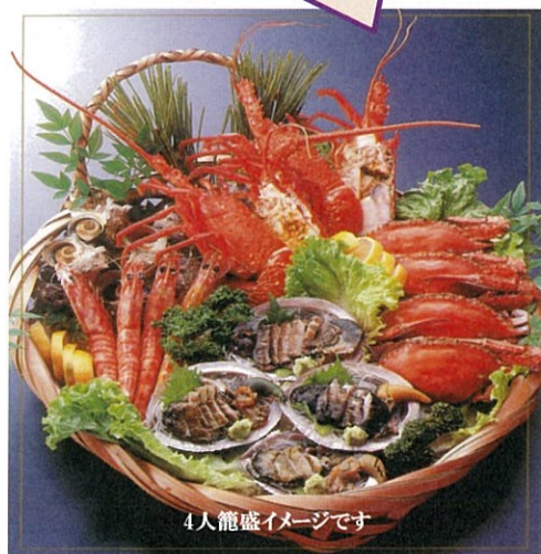
4人籠盛イメージです