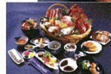
てんぽな料理 (写真はイメージ)